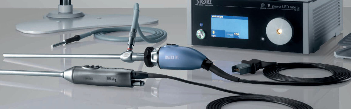
IMAGE1 S™ Rubina™ – mORe to discover